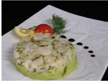
Tartare de St Jacques

Ou Bûche au chocolat et crémeux noisette et son croustillant