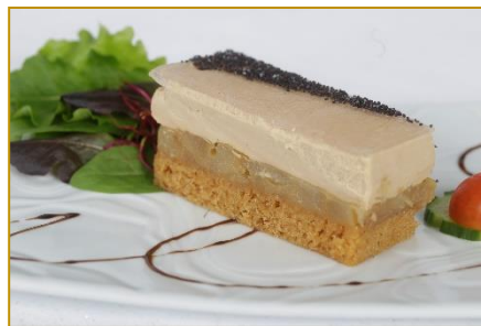
Opéra de foie gras sur son lit de poires et pain d'épices

Entremet café / cappuccino Ou Croquant au chocolat Ou Bûche Antillaise (noix de coco, mangue et fruits rouge)